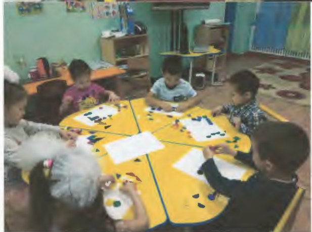
Коррекционно-развивающая методика «Ф.Фребеля»

Проведение мероприятия 1 апреля «ни кому не веря»