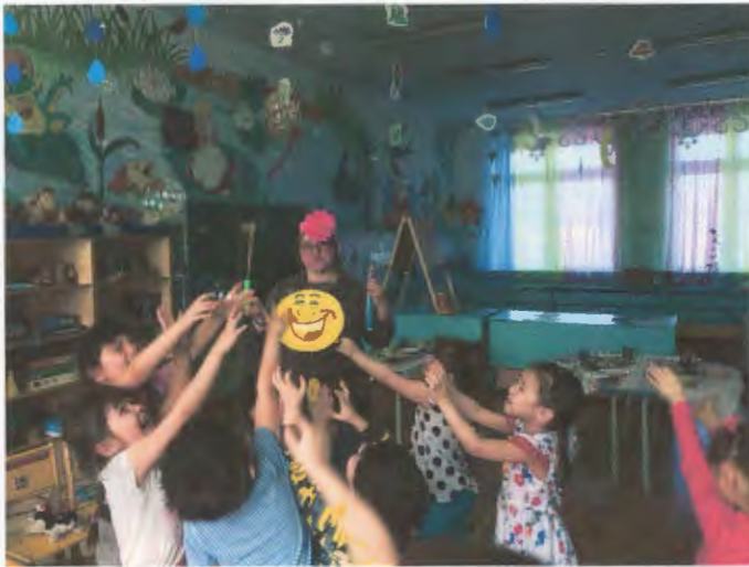
«Развитие эмоциональной сферы детей через мыльные пузыри»

3. Консультативная работа: – консультирование администрации, педагогов, родителей по проблемам обучения и воспитания детей; – проведение совместных консультаций для всех участников образовательного процесса с целью повышения психологической компетентности и обеспечения преемственности в работе с детьми.