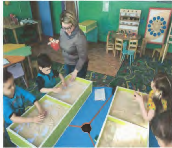
Песочные столы с подсветкой