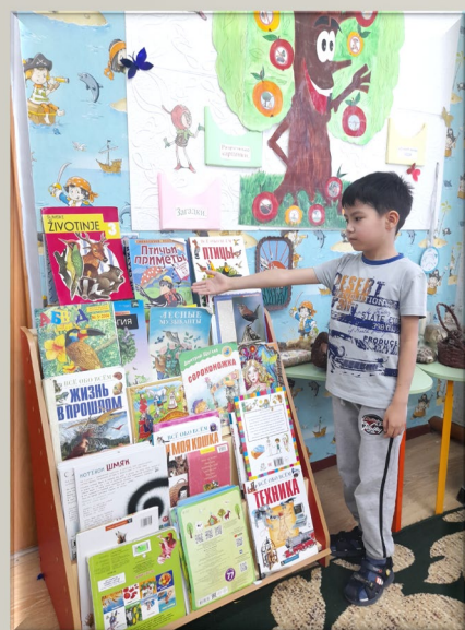
Чтение художественной литературы