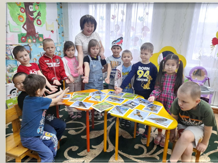
Игра «Птицы зимующие и перелетные»