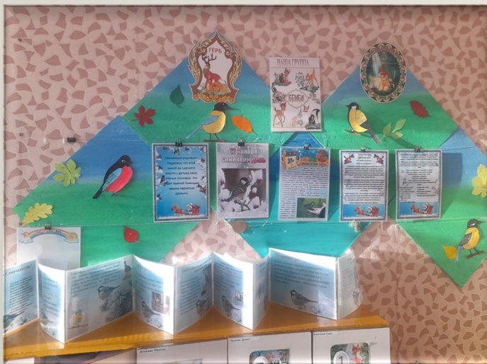
Для вас, родители