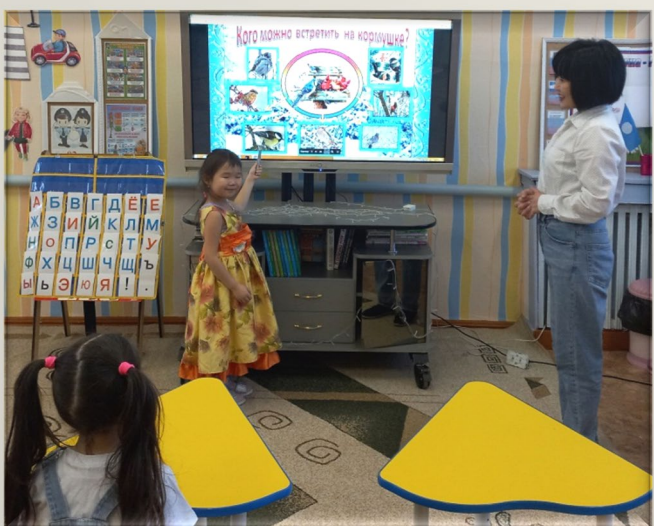
Викторина «Что мы знаем о птицах»