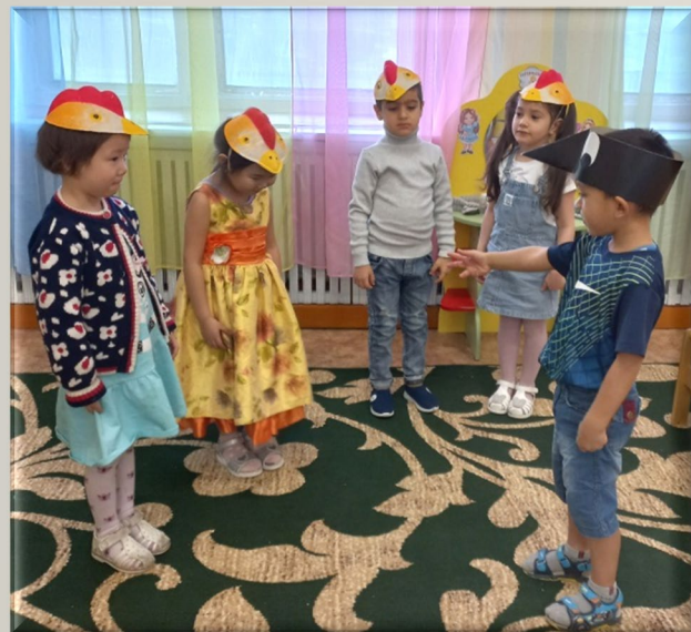
Вечерний круг. Инсценировка сказки «Лиса и заяц»