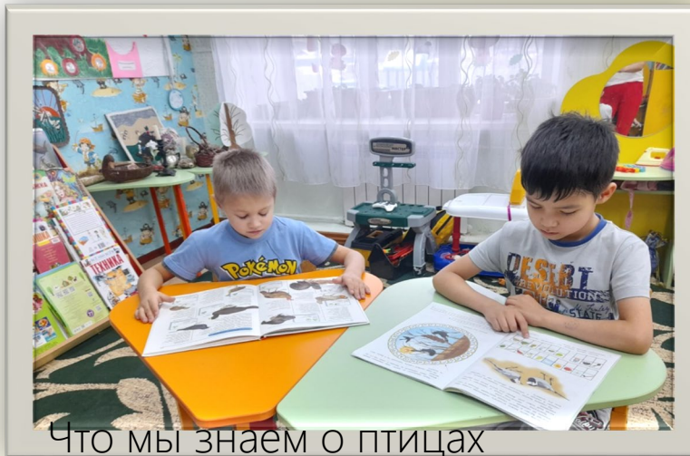
Что мы знаем о птицах