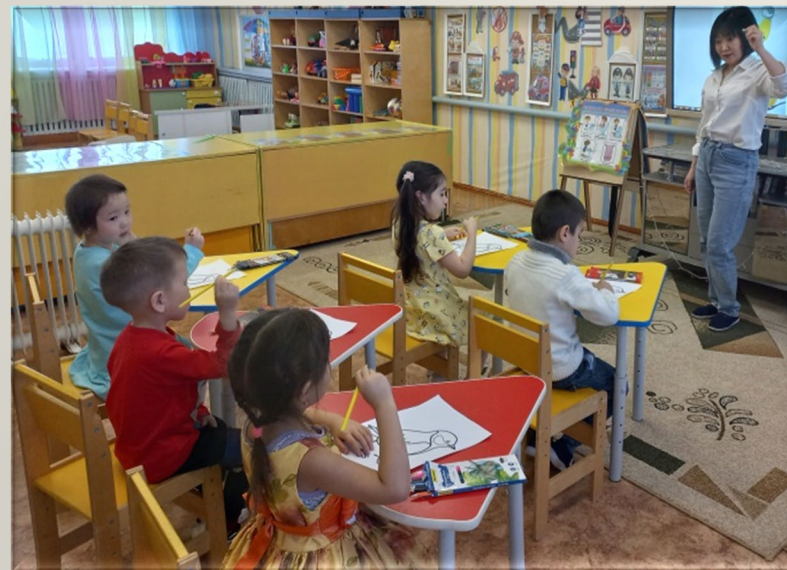
Рисование. «Зимующие птицы. Синичка»