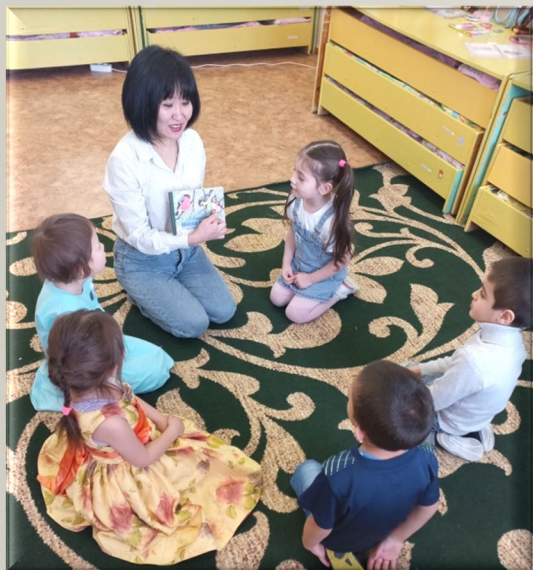
Разучивание стихотворения З. Александрова «Новая столовая»